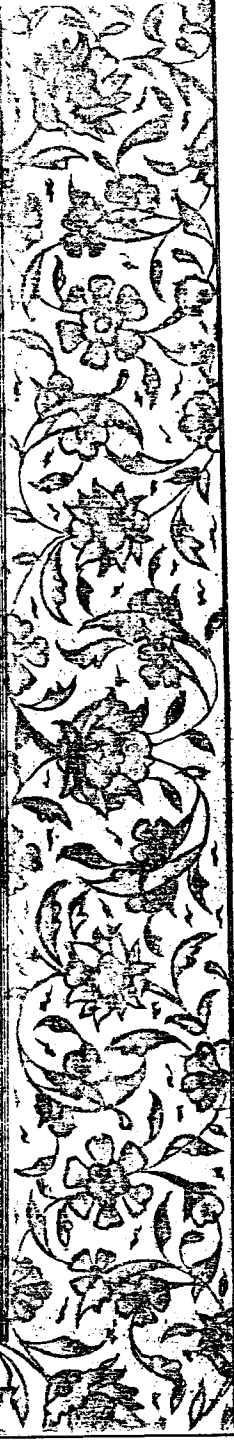
الصفحة الأولى من مخطوطة عارف حكمت الثانية

بِسْمِ اللَّهِ الرَّحْمَنِ الرَّحِيمِ الْحَمْدُ لِلَّهِ رَبِّ الْعَالَمِينَ، وصلواته على نبيه محمد وآله أجمعين قالت الشيخ أبو القاسم الحسن بن محمد بن الفضل الراغب رحمه الله أسأله الله أن يجعل لنا من أنوار توارثنا الحيرة والشريرة نوراً يضيء لنا، ويعرفنا الحق والباطل بحقيقتهما، حتى نكف عن سعي بزيدهم في الدين، وبإيمانهم، ومن الموصوفين بقوله تعالى: ﴿لَا يَخْفَىٰ أَنزَالُ السُّكُوتِ فِي قُلُوبِ الْمُؤْمِنِينَ﴾ ويقول: أويلك كفت في قلوبهم الإيمان، ويتقدم بزوج منه كنت قد ذكرت في الرسالة القديمة على فرائد الغرر أن الله تعالى كما جعل نبوة نبينا محمداً، جعل شرائعهم شريعة من وجهه منسوخة ومن وجه محله منتهية، كما قال تعالى: ﴿يَوْمَ أَكَلْتُمْ نَمْرُوتًا وَكُنْتُمْ عَلَيْهَا غُفْرًا﴾ وتضمنت لكم الأضداد، وإنما جعل كتابه المتراد عليه متضمناً لغيره، كونه القم والأول، لا م كما فيه عليه بقوله تعالى: ﴿لَوْ أَنَّهُمْ كَانُوا يَفْقَهُوا﴾ جعل من معرفة هذا الكتاب أنهم مع قلة العلم متضمن للمعنى الجم والحيث